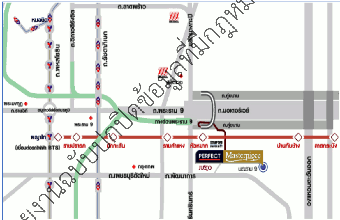
รูปที่ 1-1 ที่ตั้งโครงการโดยสังเขป

เส้นทางการคมนาคมเข้าสู่พื้นที่โครงการ จะใช้การคมนาคมทางบกโดยอาศัยรถยนต์ ซึ่งทางเข้า-ออกโครงการจะเข้าออกได้ทั้งจากถนนมอเตอร์เวย์ และ ถนนพัฒนาการ ใกล้ทางด่วนพระราม 9 (รูปที่ 1-1)